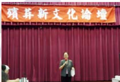
■ 民政局許副局長主持開幕

此次北市政府召開殯葬新文化論壇，是值得稱許肯定的事。以往殯葬文化的推動多是民間業者與學者走在政府前面，顯得政府對殯葬事務關心不夠，而施政總是單方面思考決定（常是想當然耳），缺乏溝通，引導與教導民眾的功能，如今台北市政府能對為人詬病而易生弊端的殯葬紅包舉行論壇，公開討論徵詢意見，值得肯定讚許，給予正面評價。固然殯葬文化非僅紅包一項，但有討論總比沒討論有進步要好，因此，我們呼籲政府多舉辦類似論壇。把忽略已久的殯葬文化重視起來，推動起來，主動宣導是重要的工作。