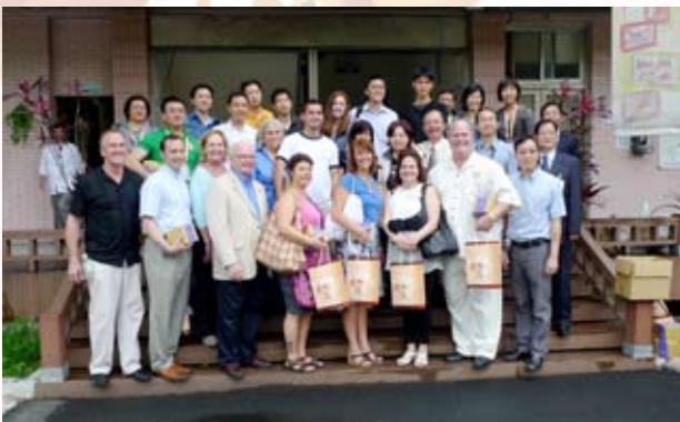
■ 參訪台北市殯葬管理處